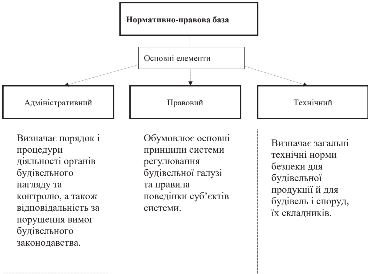
Рис. 2. Основні елементи нормативно-правової бази у сфері регулювання відносин у будівництві. Європейський досвід